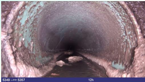
5349 --> 5357 12h